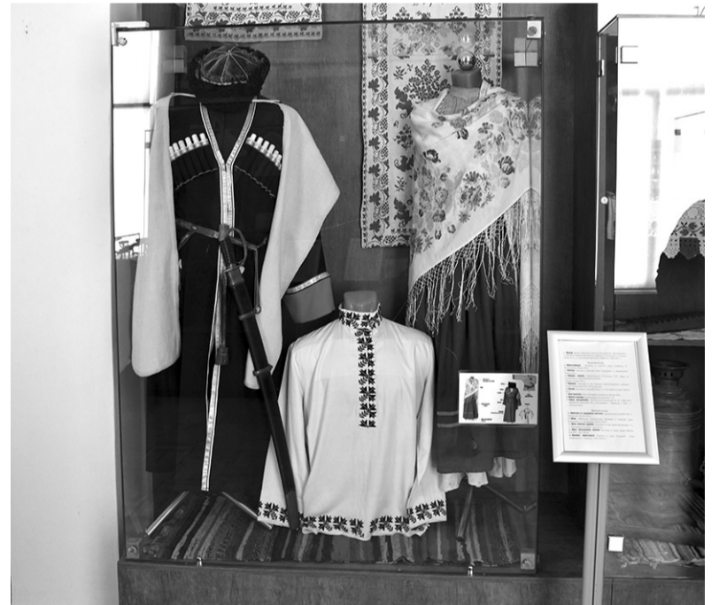
Считается, что рубаха является самой древней частью казачьего костюма

В основной рубахе делились на праздничные и повседневные. Праздничные мужские рубахи, особенно свадебные, всегда украшали вышивкой. Отделка на будничных рубахах почти не было. Будничные выходные и праздничные шились из лучшего дмотканого или фабричного полотна. Свадебную рубаху («счастливую сорочку») жениху шила сама невеста и передавала ее накануне венчания или во время «зарученья». После появления форменной одежды форма стала являться свадебной одеждой