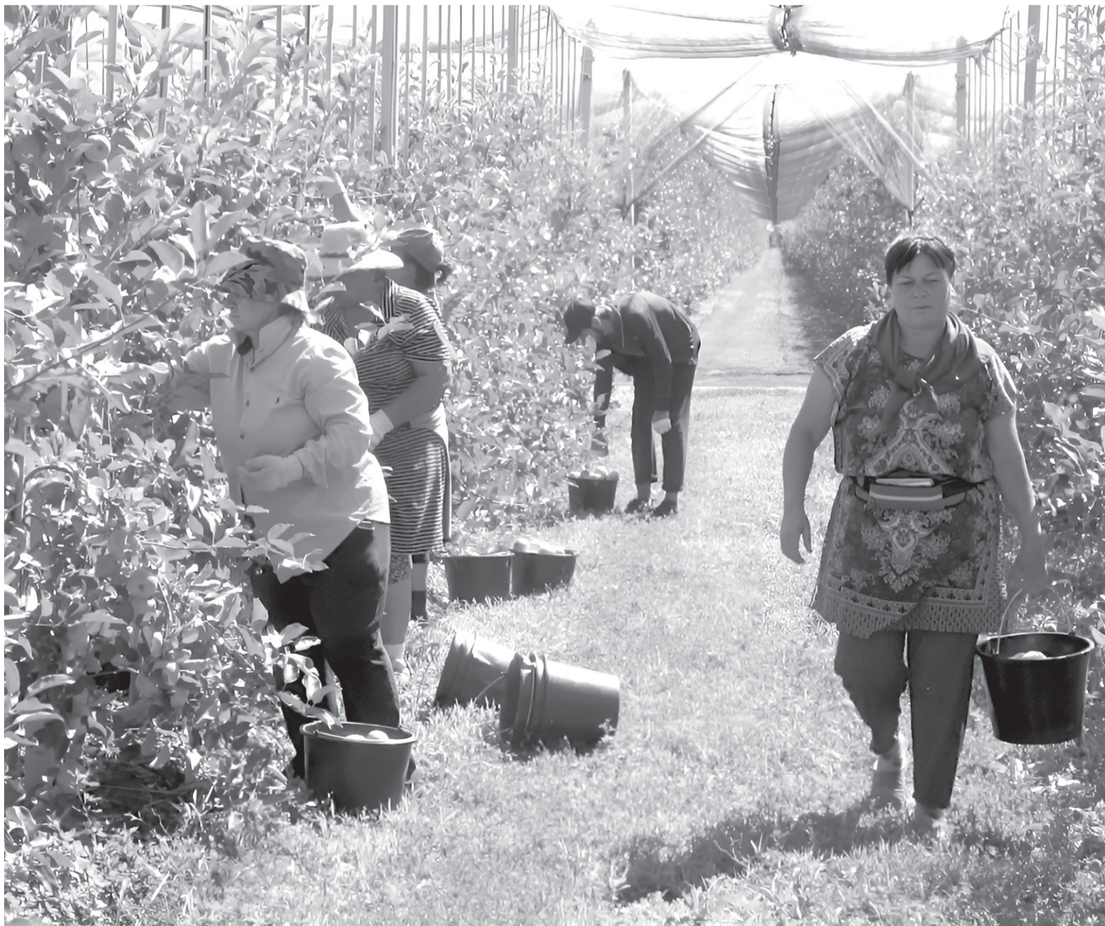
В ООО «Сады Карачаево-Черкесии» идет сбор нового урожая

На территории комплекса «Тимирязев Центр» в Москве провели 26-ю Российскую агропромышленную выставку