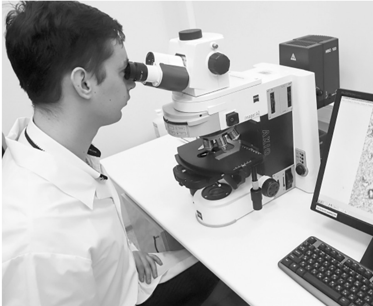
Посещать маммолога и проводить диагностику груди необходимо регулярно

— Нет, травмы рак не провоцируют. Но некоторые изменения в